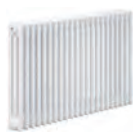
radiatori ad alta efficienza