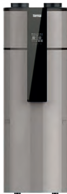
TWMMBS 2203 J TWMMBS 2303 J